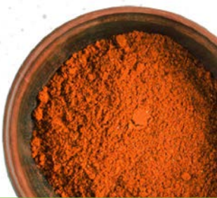
CHILE DE ÁRBOL EN POLVO