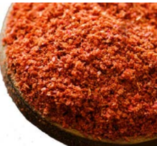
PREPARADO CHILE Y LIMÓN