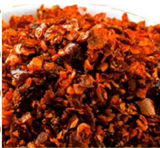
CHILE DE ÁRBOL MARTAJADO